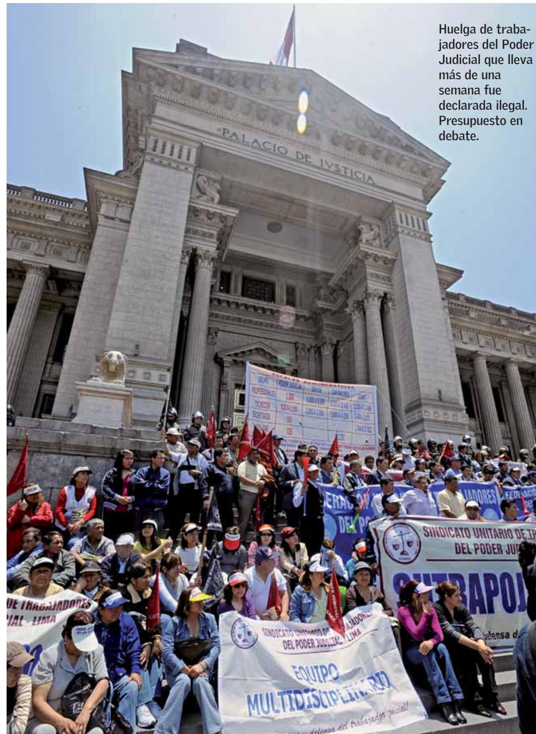
Huelga de trabajadores del Poder Judicial que lleva más de una semana fue declarada ilegal. Presupuesto en debate.

—La instalación de indicadores a nivel nacional para saber qué estamos tratando. Antes de curar a un enfermo tenemos que saber en qué estado está. Sabemos los diagnósticos, tenemos varios. Vamos a aplicar métodos bajo una perspectiva de gestión y de gerencia más que una perspectiva jurisdiccional. Los jueces no van a resolver ningún defecto de organización institucional, eso se resuelve con técnicas gerenciales