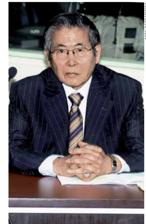
Alberto Fujimori, actor en la sombra.