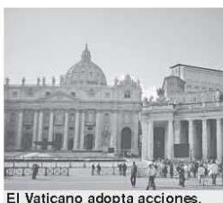
El Vaticano adopta acciones.

En la reunión, el Sumo Pontífice y los cardenales "reflexionaron", según el Vaticano, sobre los casos de sacerdotes pederastas, la situación de la libertad religiosa en el mundo y la apertura de la Iglesia católica a los anglicanos que quieren volver a Roma.