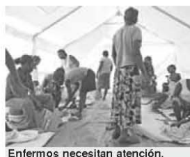
Enfermos necesitan atención.

La ONU dijo que las protestas, algunas de las cuales acusan a los Cascos Azules de haber introducido la enfermedad en Haití, están siendo "orquestradas" con la mira puesta en las elecciones del 28 de noviembre. "Si esta situación continúa, cada vez más pacientes, que necesitan desesperadamente atención médica, probablemente morirán", advirtió Mulet.