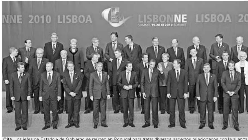
Cita. Los jefes de Estado y de Gobierno se reúnen en Portugal para tratar diversos aspectos relacionados con la alianza.

Explicó que la nueva estrategia de la OTAN no significa que se abandone el papel tradicional de defensa mutua ante un ataque exterior, sino que se complementa habilitan-