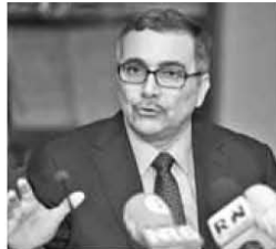
Canciller Castro hizo anuncio.