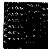
FLORA ADESLAIDA BOLIVAR ARTEAGA Fiscal de la Nación