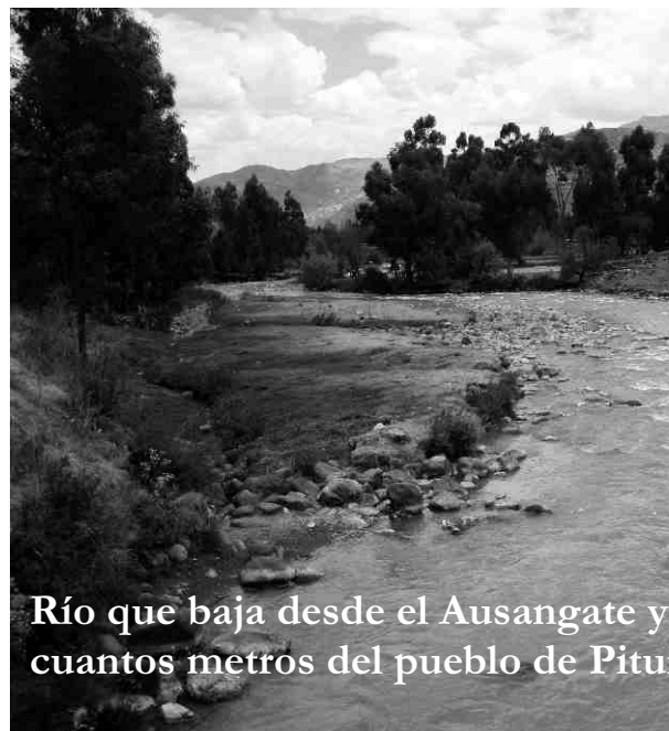
Río que baja desde el Ausangate y pasa a unos cuantos metros del pueblo de Pitumarca