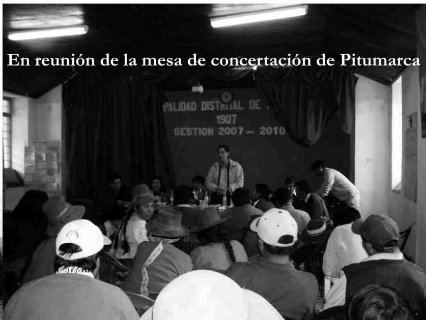
En reunión de la mesa de concertación de Pitumarca